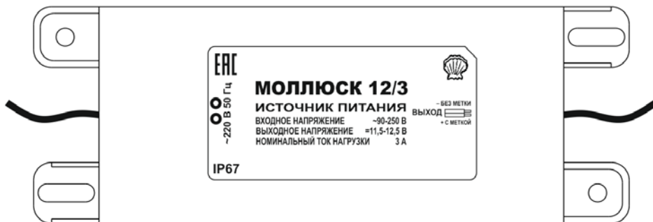
Рис.1. Внешний вид.