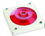
МАЯК-220-КПМ1-НИ оповещатель комбинированный, металлический корпус, наружное исполнение