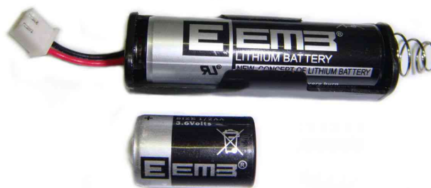
Рисунок 6 Батарея FS-TP версии 2.x, батарея предыдущей модели

Важное замечание: Вскрытие батарейного отсека жезла в течение 12 месяцев после изготовления приводит к потере гарантийных обязательств производителя. В случае необходимости проведения данной операции необходимо согласование с производителем.