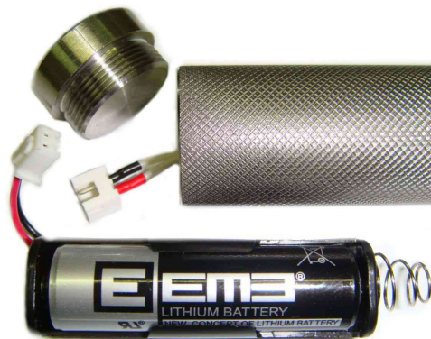
Рисунок 7 Замена батареи