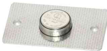
Рисунок 2: Крепление точек контроля

По маршруту следования контролируемого персонала необходимо установить точки контроля. Точка контроля - электронный идентификатор iButton(DS 1990A-F5).