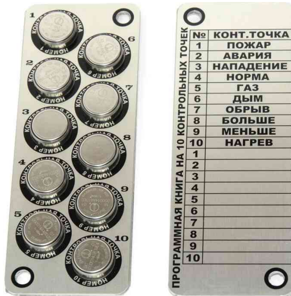
Рисунок 3 Программная книга FS-PR