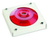
МАЯК-220-КПМ1-НИ оповещатель комбинированный, металлический корпус, наружное исполнение