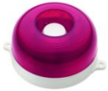
МАЯК-12-КП, МАЯК-24-КП оповещатель комбинированный