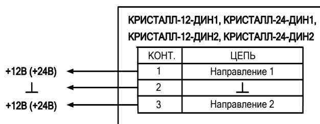
Рис. 1. Схема подключения

3.2. Подключение изделий должно выполняться в соответствии со схемой (рис. 1.).